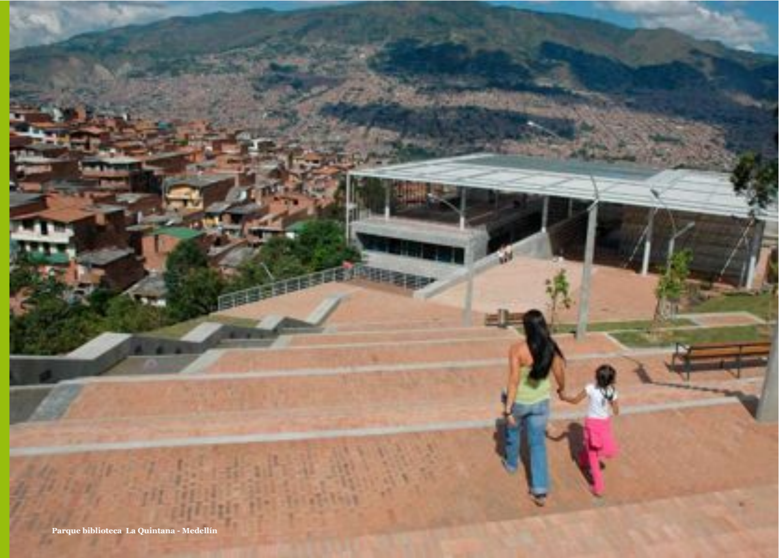
Parque biblioteca La Quintana - Medellín

Medellín ha sido llamada por muchos 'Ciudad de la eterna primavera', con un clima templado que oscila entre los 18°C y 28°C ó 64°F a 82°F, lo que la hace una ciudad atractiva para el turismo, los negocios, la educación, el comercio, los deportes y la cultura.