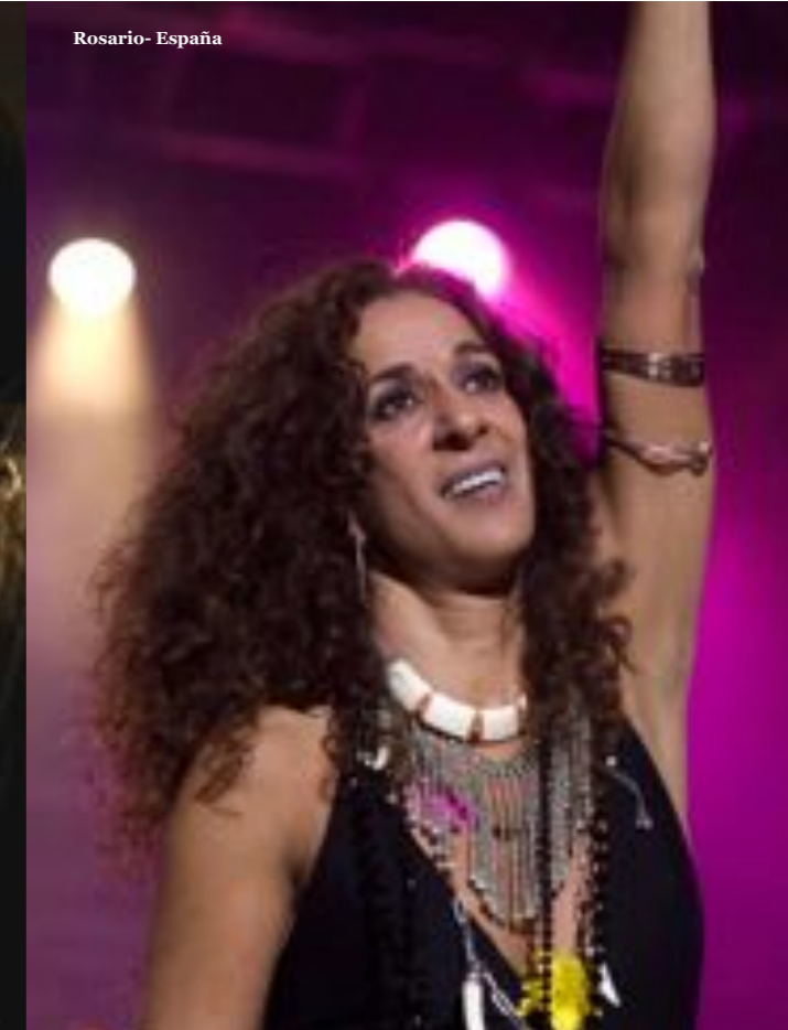
Rosario - España