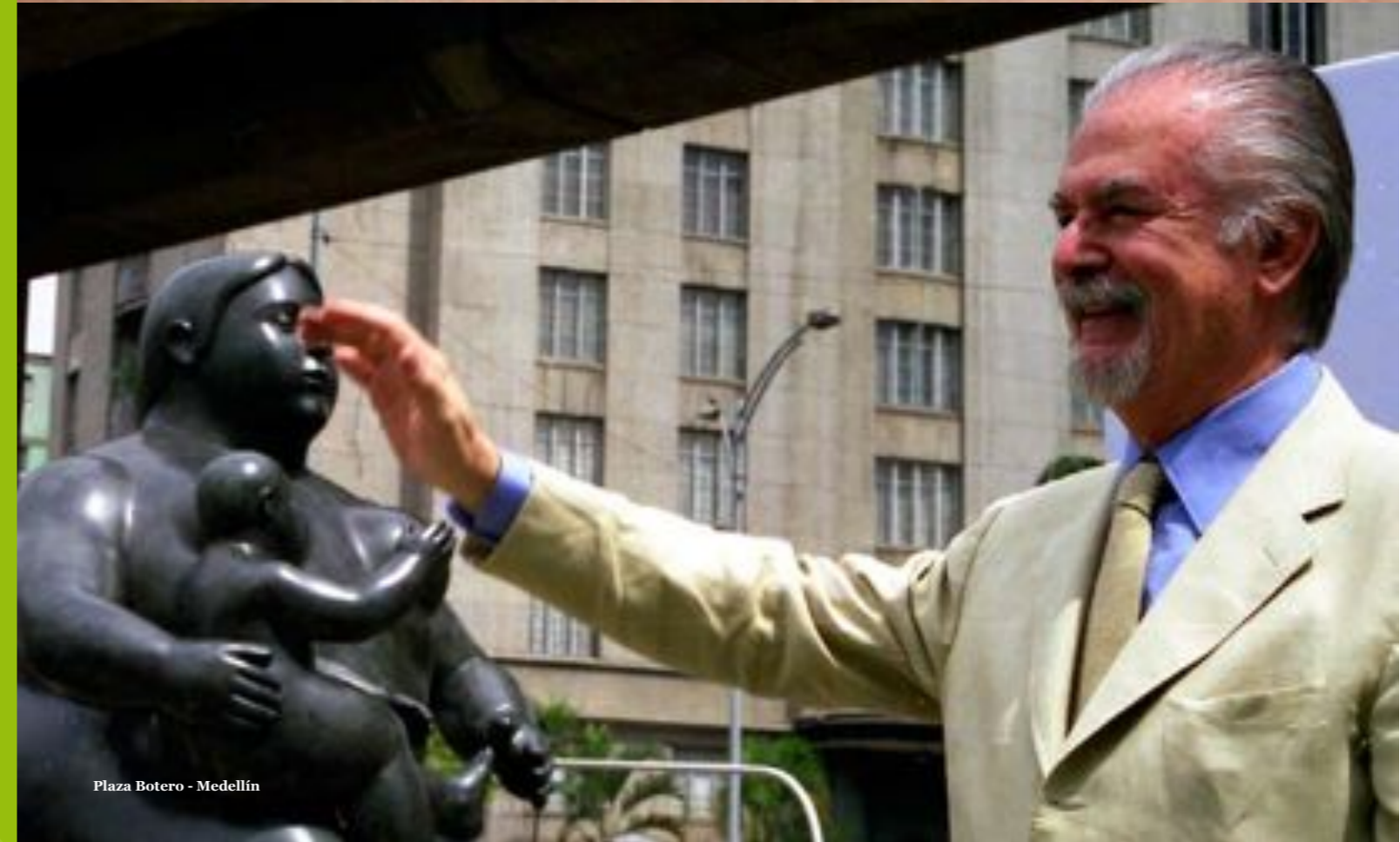
Plaza Botero - Medellín