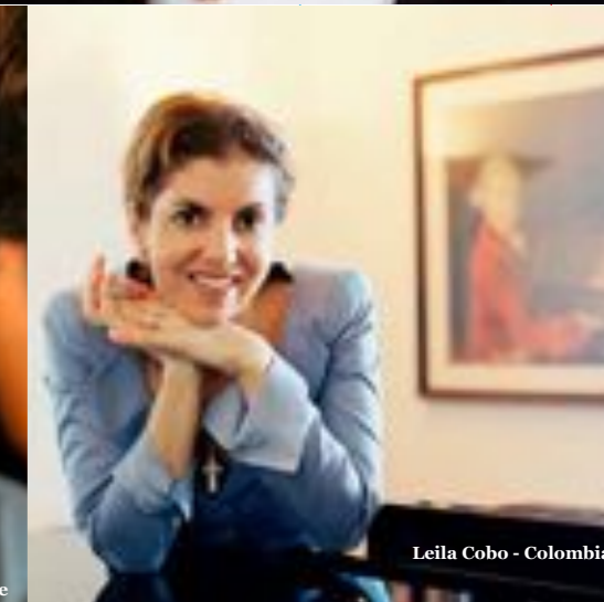
Leila Cobo - Colombia