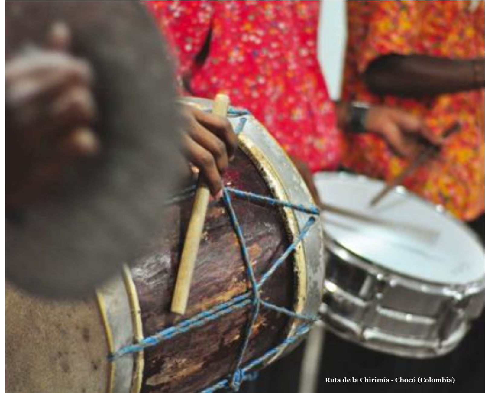
Ruta de la Chirimía - Chocó (Colombia)